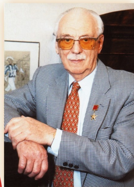
Михалков Сергей Владимирович (1913 - 2009) Поэт, драматург Автор Государственного гимна России

Басни и стихи его Знают все до одного. Не прочтешь нигде такого, Только в книжках Михалкова.